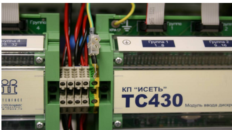
Рис 2. Подключаем дополнительный защитный диод