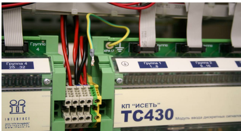
Рис 1. Извлекаем провод заземления из клеммы

Комплект для доработки (переходная зажимная клемма и диод) высылается почтой по заявке.